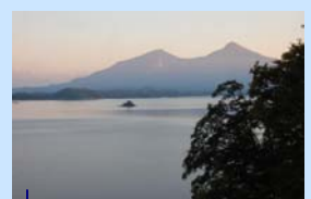
檜原湖のある裏磐梯は、 美しい景色が広がる