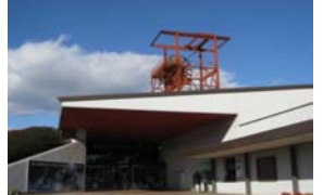
常磐炭田の歴史がわかるいわき市石炭・化石館