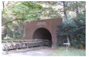
六坑人車口の坑口