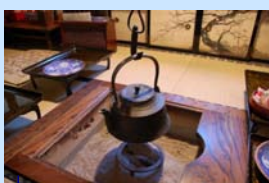
囲炉裏や黒電話など古く からの道具を見ることが できる