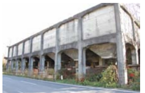
採取した石炭を貨物列車に積み込んだ磐崎坑の万石跡

問 いわきフラオンパク実行委員会事務局(電話0246-43-7923) http://iwakihula.onpaku.com