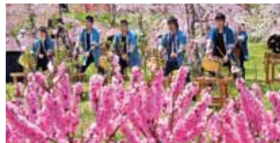
4月中旬に行われる「花ももの里まつり」

「花ももの里」は、地区住民と協働で40品種300本以上もの花ももを植栽し、春には百花繚乱、鮮やかな風景を演出します。