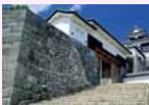
白河小峰城(現在は被災 を受け修復工事中)

白河口の戦いでは城に拠る東軍 を西軍が三方向から攻撃した五月 朔日(新暦六 月二十日)の 戦が最も激し い。白河では 約百日に渡る