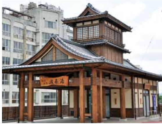
平成 23 年に新築された波来湯 (はこゆ)

飯坂温泉は、鳴子・秋保とともに奥州三名湯に数えられ、俳聖松尾芭蕉も奥の細道の途中に立ち寄ったとされる歴史ある温泉です。 泉質はアルカリ性単純温泉で熱いお湯が特徴です。