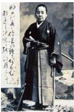
入城当時を記念する写真(両 刀、銃、草履は形見)

戊辰戦争で全く異なる経験をし た兄と妹、その波乱に満ちた運命 は、二人が再開する京都で更なる 展開を生むこととなる。