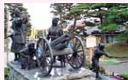
二本松少年顕彰碑(霞ヶ城公園)

二本松の戦いでは「白虎隊」と 並び称される「二本松少年隊」の 悲劇が今も語り られている。十二 歳から十七歳の 少年兵部隊で多 くの若い命が戦 場に散つた。