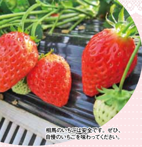
和馬のいちごは安全です。ぜひ、自慢のいちごを味わってください。

和馬市和田下柴迫 94 TEL・FAX 0244-36-5535 HP http://blog.wadakanko-ichigo.jp/ 営業時間: 10時～16時(休日の翌日が休み) いちご狩り入園料 (小学生未満半額) 3 / 25まで……1,200円 3 / 26～5 / 6…1,000円 5 / 7～5 / 31…800円