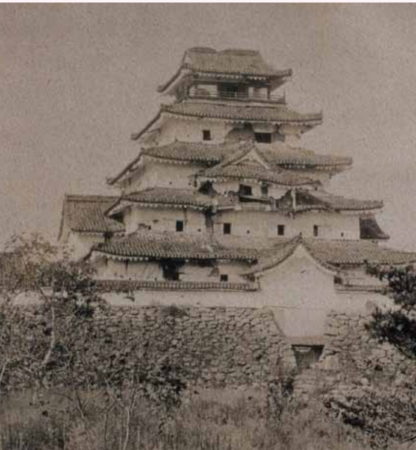
新政府軍の砲撃により傷ついた会津鶴ヶ城（会津若松市所蔵）