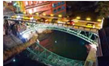
ライトアップされる十綱橋

温泉街を散策するには、駅の「電動レンタサイクル」がおすすすめ。坂の多い温泉街の強い味方です。