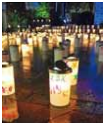
キャンドルナイト (イメージ)