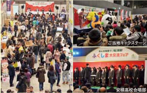
ご当地キャラステージ

平成 25 年 12 月 23 日、東京国際フォーラムにて「みんな笑顔で、「福」満開! ふくしま大交流フェア」を開催しました。ふくしまの元気を発信するとともに、「ふるさとふくしま」を届けるイベントとして今回で 7 回目の開催。首都圏の方を中心に約 1 万 5 千人の方にお越しいただきました。