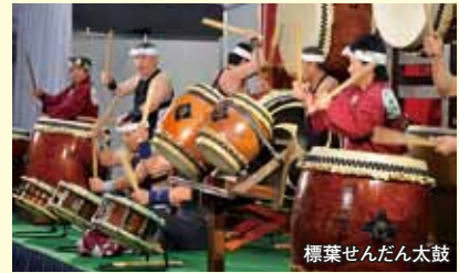
標葉せんだん太鼓

ステージでは、スバリゾートハワイアンズの「フラガール」による特別公演や合唱王国ふくしまから県立安積高校合唱部のライブ、双葉町の「標葉せんだん太鼓」と会津の祭り「会津磐梯山踊り」が披露され、会場が一体となって盛り上がりました。