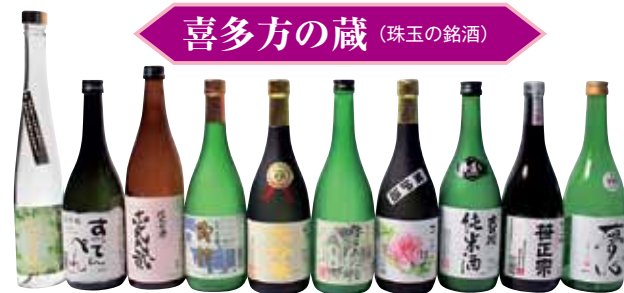
喜多方の蔵 (珠玉の銘酒)

見学 常時可(但し酒蔵見学 土日祝日除く) 喜多方市松山町村松字常盤町2706 酒蔵見学試飲雲嶺庵 TEL 0241-22-5155 営業時間/9:00~16:30 休み/年末年始