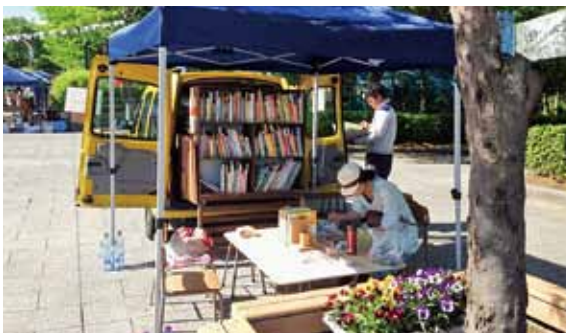
「みず文庫」図書館開館の様子