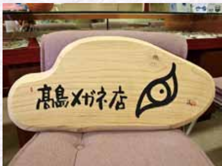
写真はメガネ店の看板

市内を散策すると商店の軒先に奇妙な文字の看板が、あちらこちらに見受けられます。商店の名称と店主が希望した漢字一文字が桐の看板に書かれているのです。メガネ店には「目」、生花店には「咲」、アロマ店には「癒」、FMの会社には「響」といったふうに、市内に約160もの看板が飾られています。