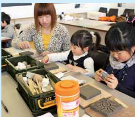
粘土に絵を描いて陶板レリーフに仕上げたワークショップ

除幕式にあわせて、陶板レリーフやステンドグラス制作のワークショップも開催され、訪れた子供たちが思い思いの作品を作っていました。