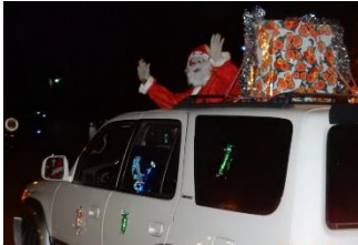
サンタが車に乗って街中に挨拶していました。