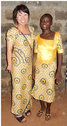
私の服を作ってくれた洋服屋さんと一緒に☆

日本では、大みそかや元旦を一年の中でも大切な日の一つと考えますが、ベナンでは、クリスマスやその前後に開かれる地域のお祭りが、大みそか以上に盛り上がるようです。年末年始も、12/25と1/1しか、仕事は休みになりません。