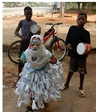
ダンスが上手にできたら、日本円で20円くらいを渡します。

右の写真は『エグングン』と呼ばれ、年に一度この世に戻って来る霊が宿っていると信じられています。なので、絶対に触ってはいけません。でも、カメラに向かって『ピース』をしてくれる、ちょっとお茶目なエグングンでした。