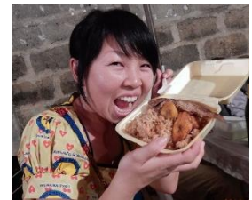
お弁当の中身は、魚のフライ、バナナの素揚げに味付けご飯。

各地区ごとにお祭りのようなものが開かれ、それに参加するためには、地区の名前の入った布を購入して服を作ります。私の住む地区では、布を買うと、入場券・お弁当・飲み物4本のチケットが付きました。それを食べたり飲んだりしながら、お揃いの服を着た何百人もの人たちが、明け方まで、歌ったり踊ったりして楽しんでいました。