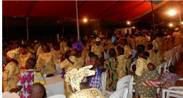
同じ柄の服を着た人がたくさん！！