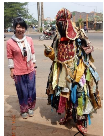
全身布で覆われて、顔も見えなくなっています。(暑そう...)