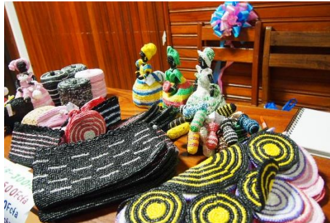
②小物入れ、ポーチ、人形