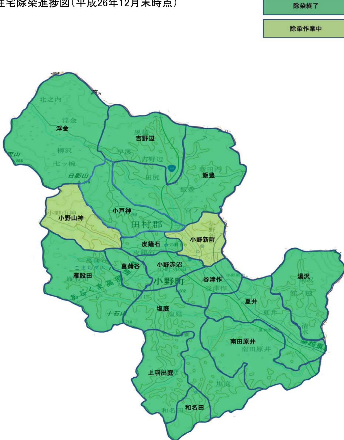
住宅除染進捗図(平成26年12月末時点)