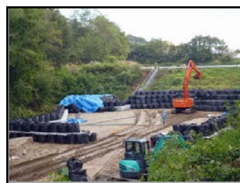
周辺を遮へい土のうで覆い、除去土壌等を据付