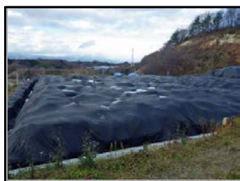
除去土壌等を遮水シートで覆って保管