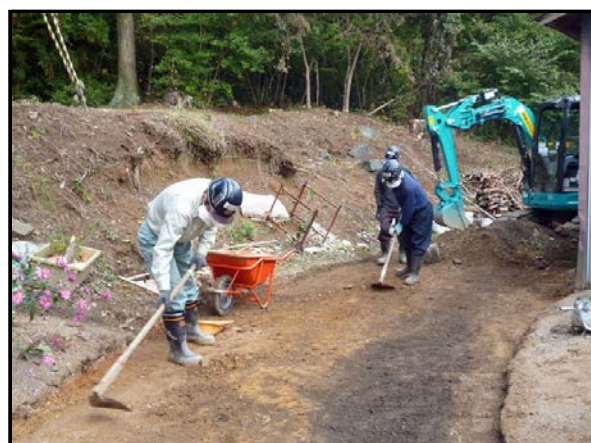
住宅周りの表土除去