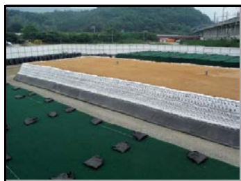
土のうで遮へいし、 遮水シートで覆う前の状況