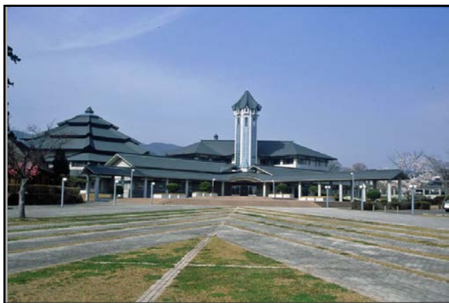
国見町役場仮庁舎(国見町観月台文化センター)