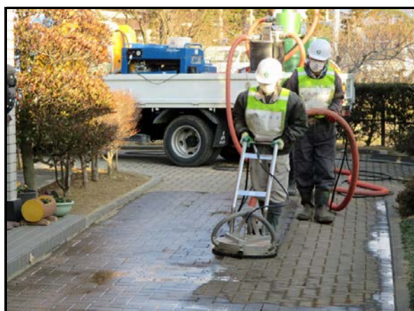
回収型高圧洗浄機による作業