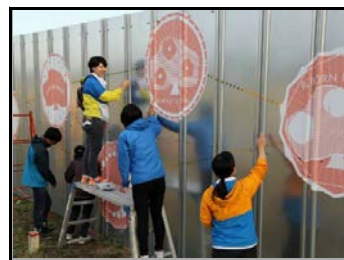
仮置場外壁にデザイン画で装飾