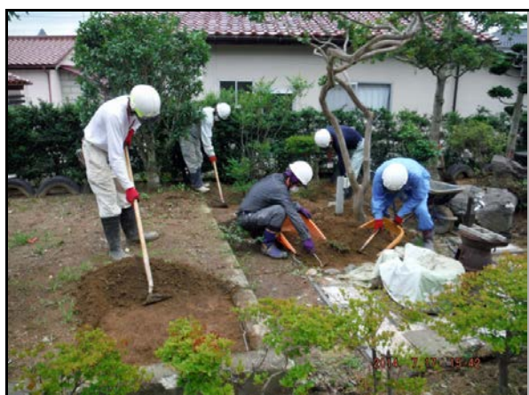
除染作業(表土除去作業)