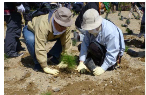
森林（もり）づくり活動の事例