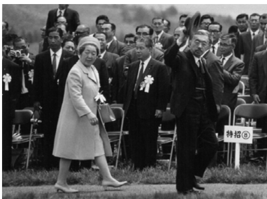
大会会場に御到着された天皇皇后両陛下