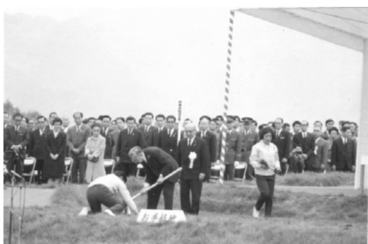
天皇陛下によるお手植え