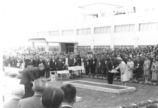
天皇皇后両陛下のお手播き 郡山市 福島県林業試験場にて (昭和45年第21回全国植樹祭)