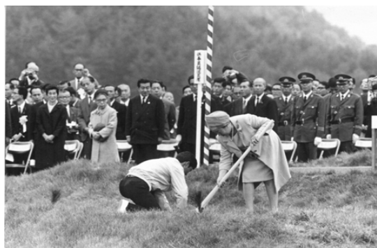
皇后陛下によるお手植え