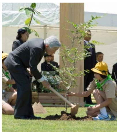
天皇陛下 お手植え (平成26年第65回全国植樹祭)

参加者の植樹樹種は、各会場の特性に沿って選定し、県内外の参加者は、1人複数本を植栽していただきます。なお、詳細については、「基本計画」の中で検討します。