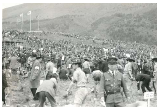
一般参加植樹状況