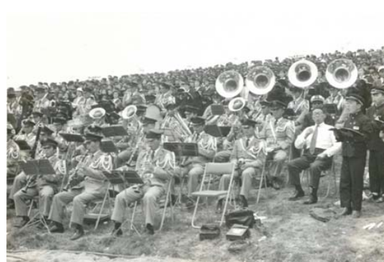
陸上自衛隊音楽隊による演奏