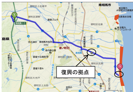
かいばま しどけ ＜原町地区（萱浜・雫）＞