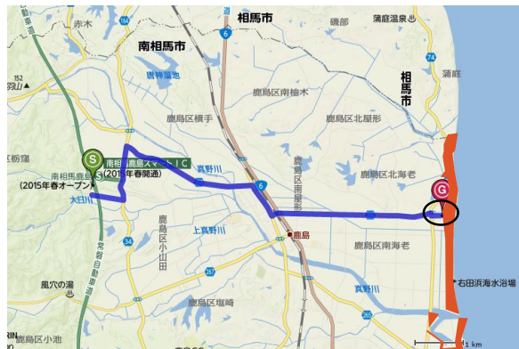
きたえび みなみえび ＜鹿島地区（北海老・南海老）＞