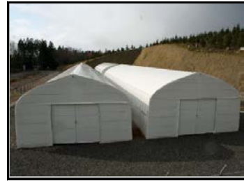
仮置場（裏側から撮影）