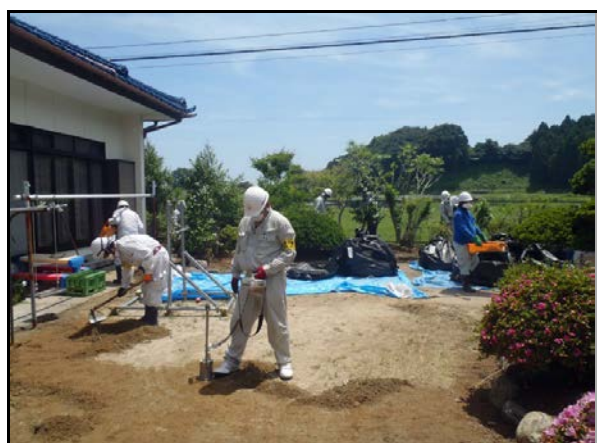
家屋除染作業 (H24当時)