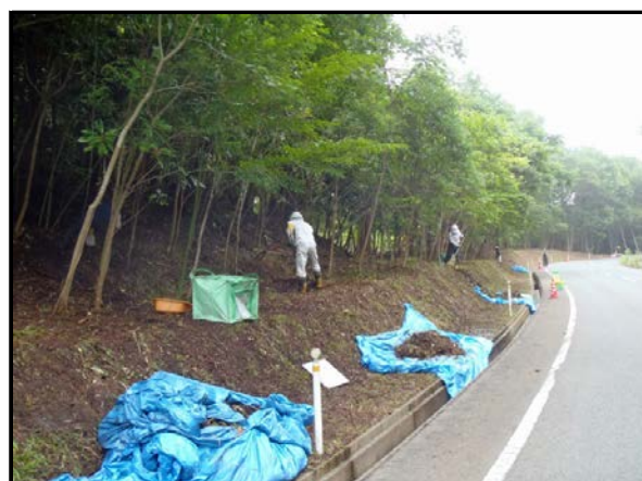
道路路肩除染作業 (H25当時)