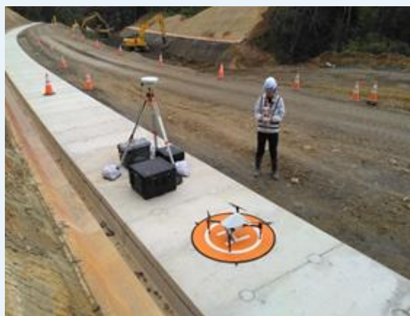
【ドローンを使用した進捗数量の確認】