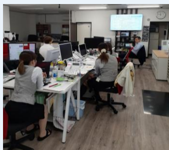
【電帳法・インボイス講習】