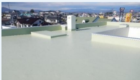
【高い技術力でCO2排出量削減】