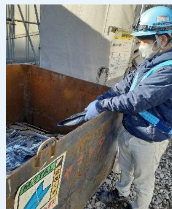
【廃棄物の分別・リサイクル】