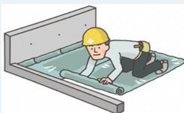
【防水施工技能士資格取得助成】