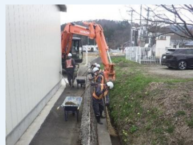
【側溝の土砂撤去奉仕作業】

・郡山市の花いっぱいコンクールに、「二嘉組隣組会」として地域住民の方々と一緒に参加しています。