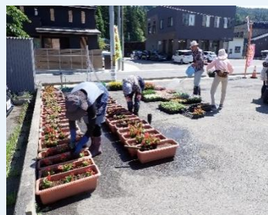
【花いっぱいコンクール 花苗植え】