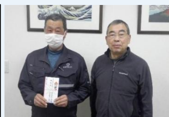
【資格取得で報奨金】