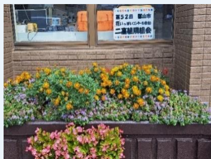
【花いっぱいコンクール】

・近隣の温泉施設周辺の側溝に堆砂した土砂の撤去清掃奉仕作業を実施し、蚊などの害虫発生を予防しています。