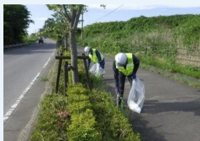
【「アイラブロード事業」清掃奉仕活動】

・郡山市民の快適な環境づくりに貢献する「アイラブロード（道路環境美化）事業」で清掃奉仕活動に参加しています。