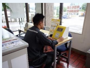
【ベジチェック測定中】