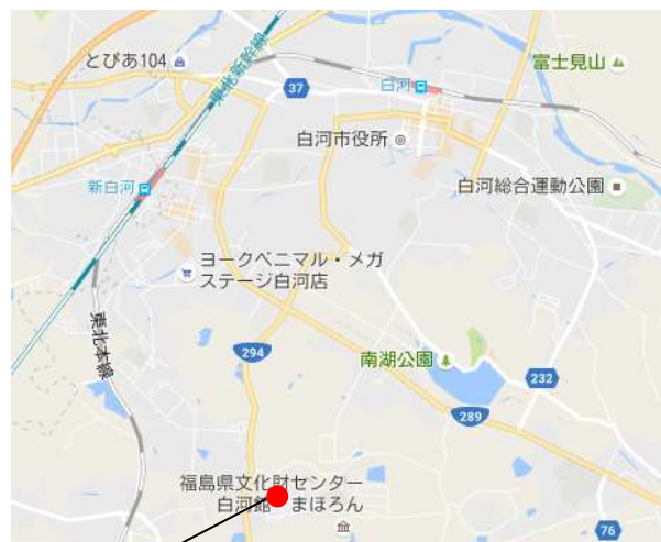
白河市白坂一里段 地内