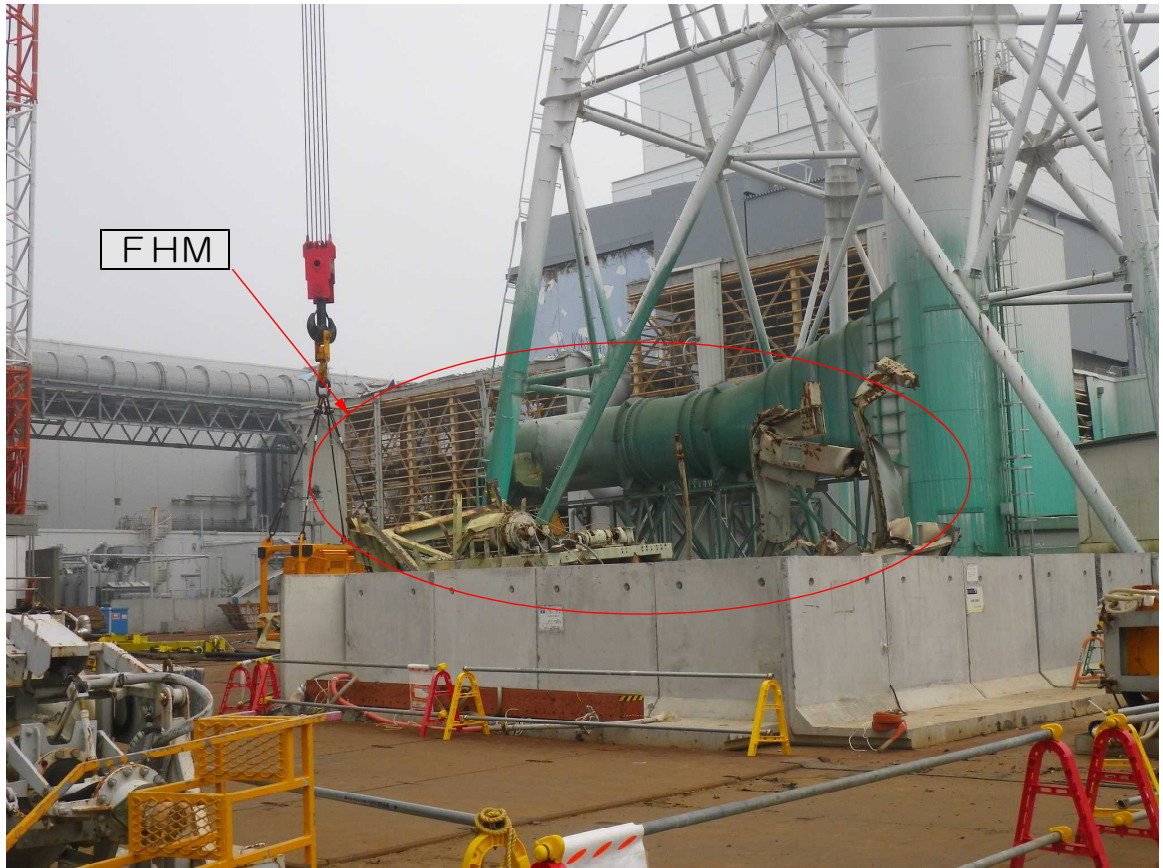
② FHMが置かれている状況（拡大）（午後2時21分） 3・4号機共用排気筒付近から撮影。