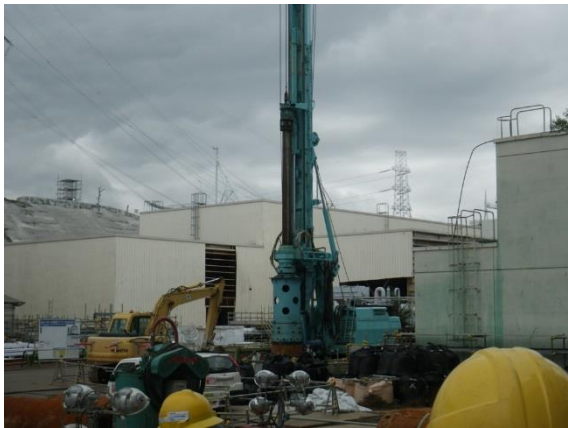
サブドレンピットを掘削する重機