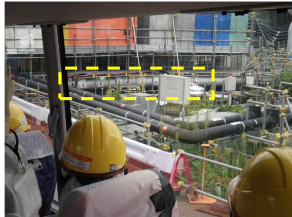
平成 29 年 8 月 22 日に凍結が開始された西③ 凍結管の状況 (バス車内から確認した。)