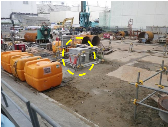
No. 51 サブドレンピット (拡大写真)