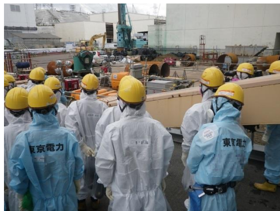
4号機原子炉建屋周辺（平成 29 年 8 月 2 日に一時的な水位低下事象が発生したサブドレンピット No. 51 周囲の状況を確認している様子）