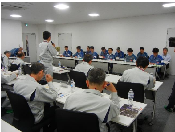
小野危機管理部長からの挨拶