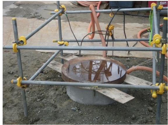
No. 215 サブドレンピット (増設されたサブドレンピット) (拡大写真)