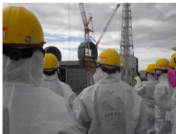
1, 2号機開閉所前（3号機燃料取り出しカバー設置状況を確認している様子。）