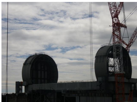
3号機燃料取り出しカバー設置状況 （拡大写真）