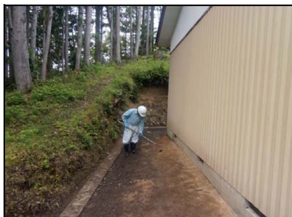
表土剥ぎ取り(人力)