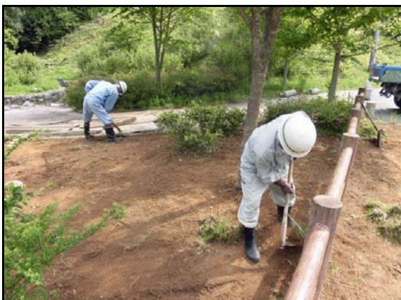
除染作業状況(公園施設)