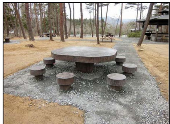
除染完了後状況(公園施設)