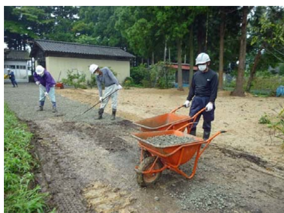
住宅除染実施状況