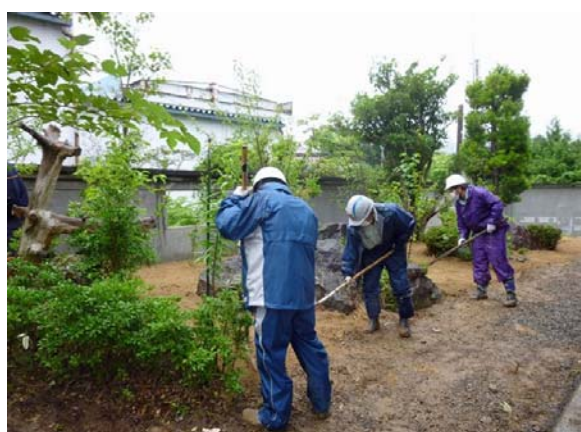
住宅除染実施状況