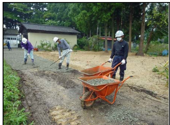
住宅除染実施状況