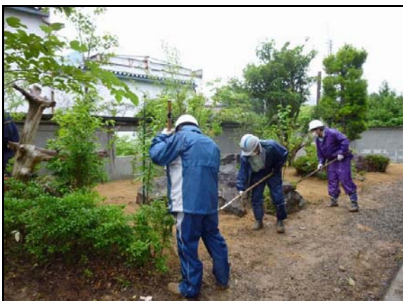
住宅除染実施状況