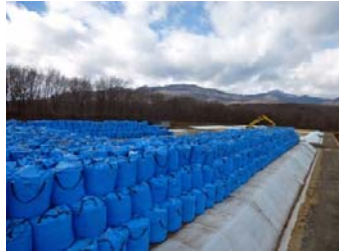
仮置場造成の様子