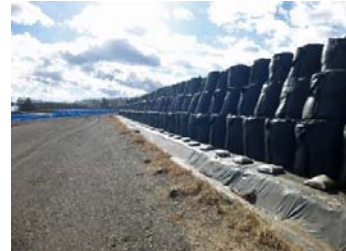
仮置場での保管の様子