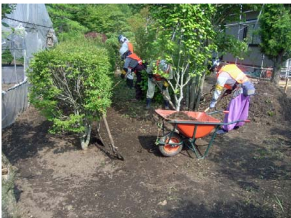
汚染土壌剥ぎ取り作業