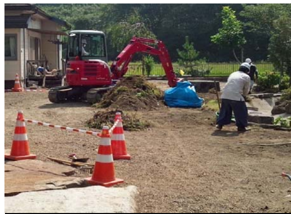
住宅敷地内の除染作業