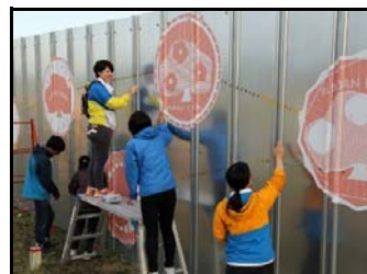
仮置場外壁にデザイン画で装飾