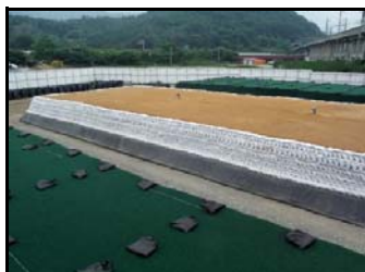
土のうで遮へいし、 遮水シートで覆う前の状況