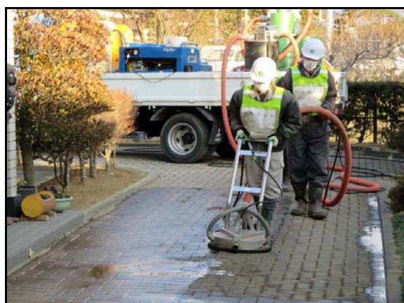
回収型高圧洗浄機による作業