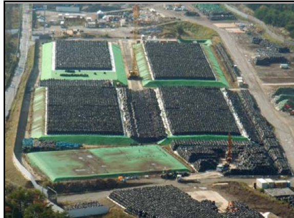
広野火力煙突からの風景 (H26. 11. 11時点)