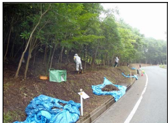
道路路肩除染作業 (H25当時)