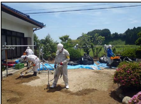
家屋除染作業 (H24当時)