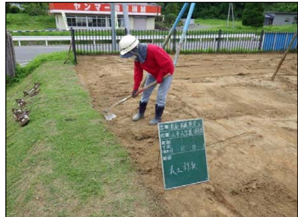
校庭除染工事表土剥取