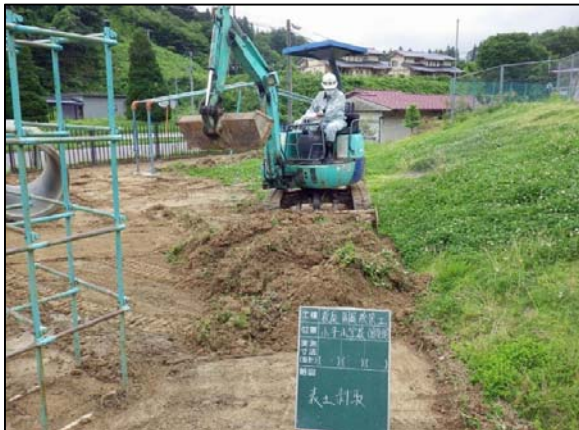
校庭除染工事表土剥取