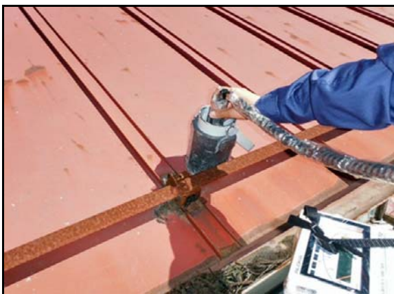
屋根の表面線量率測定