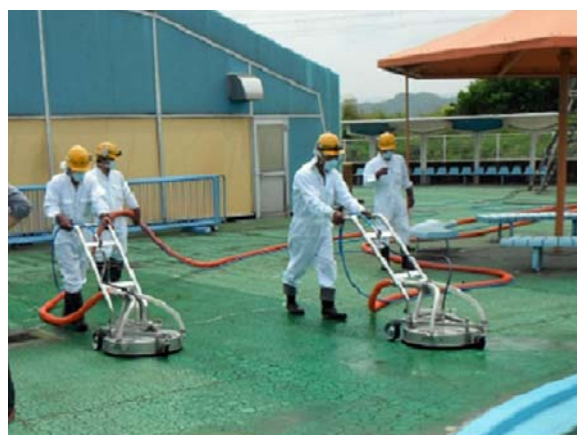
同時吸引型高圧洗浄実施