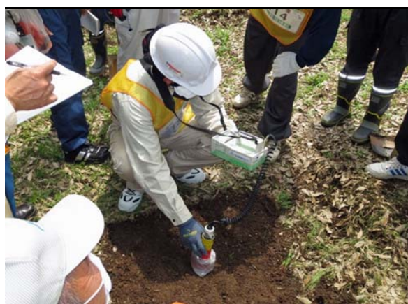
コリメータ使用し線量確認