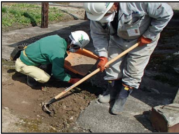
土壌剥ぎ取り作業