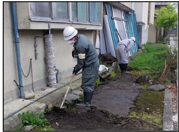
土壌剥ぎ取り作業