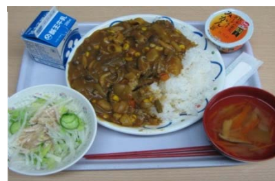
写真1 給食献立の一例