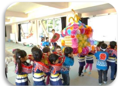
【おみこしわっしょい】

年間10回の交流を行っています。これまで、学習発表会や水遊びなどで交流をしてきましたが、10月には「あきまつり」を仲良く楽しみました。