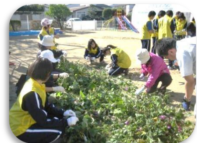
【保育園での清掃作業】

11月には、この取り組みが評価され、「第36回郡山市青少年健全育成推進大会」で表彰を受けました。