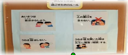
居室前の廊下や居室には今日の予定と宿直者等子どもたちにかかわる内容を掲示しています。