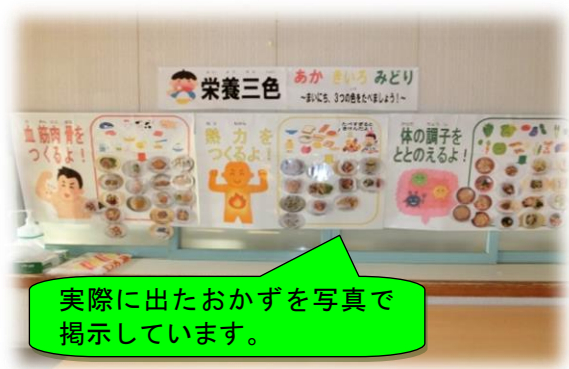
実際に出たおかずを写真で掲示しています。

本校寄宿舎には、聴覚に障がいのある子どもたちが、中学部 14 名、高等部 12 名が生活しています。 子どもたちがより良い集団生活を送ることができるよう、そして、自主的に生活や学習することができるよう、居室や廊下、共有スペース（食堂、浴室等）に、生活していく上で必要な内容やルールを具体的かつ視覚的に示して支援しています。