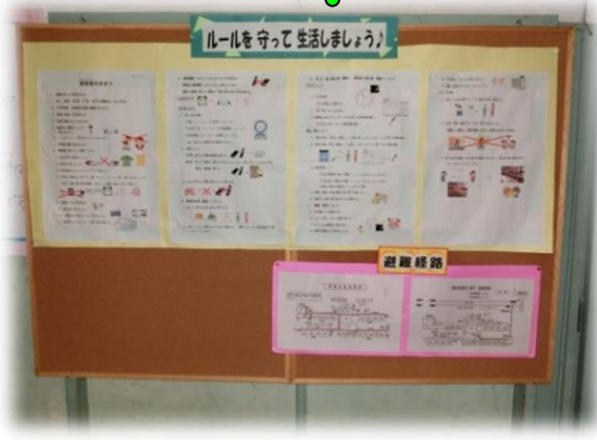
全体指導後、個別指導へ生かせるように指導内容ごとにまとめ、掲示板や廊下に掲示しています。