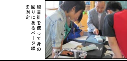
線量計を使って身の回りにあるベータ線を測定