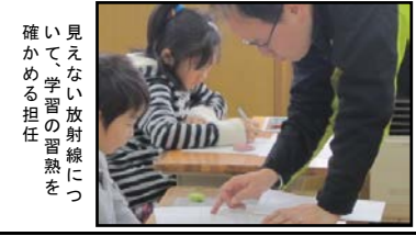
見えない放射線について学習の習熟を確認する

感をついで、私たちに緊迫 感をついで、私たちに緊迫 感をついで、私たちに緊迫 感をついで、私たちに緊迫