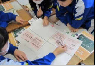
放射線の影響について分類し、課題の共有化を図る

感をついで、私たちに緊迫 感をついで、私たちに緊迫 感をついで、私たちに緊迫 感をついで、私たちに緊迫