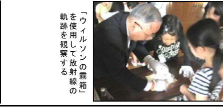
「ウイソンの霧箱」を使用して放射線の軌跡を観察する

強導点どま知る分よい 研加祉地教いく童一和宮研まる支所お教育今年 くにをもた、この変現すでなり、約な委員した、ご授業し、育修事校 子当踏た、この変現すでなり、約な委員した、ご授業し、育修事校 子当踏た、この変現すでなり、約な委員した、ご授業し、育修事校