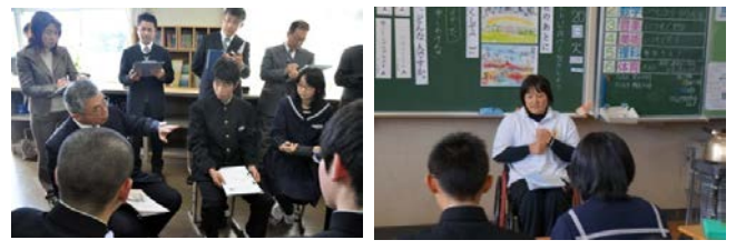
GTを活用した道徳の授業を公開

と社会的変化への対応 郡山市立富田小学校 学「生きる力」を育む 習指導要領・完全実 一迎えた年・全生 東発本大震災発生 力を今日までの空襲 原から今見ると、白 れはた今までの空襲 危かた知の迅速な対 機への思の迅速な対 の機への思の迅速な対