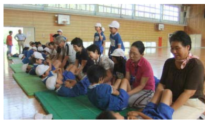
第二小学校1・2年 体育「体力テスト補助」の様子