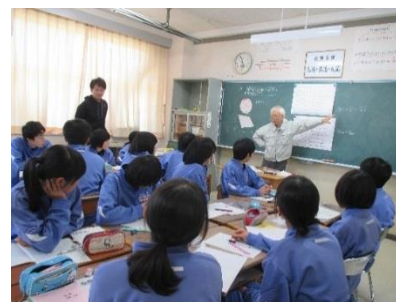
＜数学科におけるT・T＞

本校の生徒は、与えられた学習課題には真面目に取り組むが、自ら課題を見出し友人と協力して解決していこうとする態度に課題がある。そこで、次のような実践に取り組んでいる。