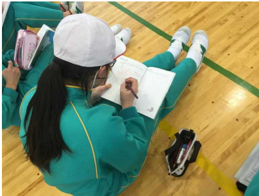
《体育の授業で活用しました》