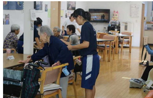
3年生が老人ホーム等施設へ訪問

地域清掃やボランティア活動は、生徒会役員が中心となり、12月に実施した。今年度は、夕方からのボランティア活動は、暗く危険であることとゴミが見つけにくいことから、週休日に行ってみた。週休日にも関わらず、30名以上の生徒が参加し、ゴミ袋6袋分のゴミを拾うことができた。