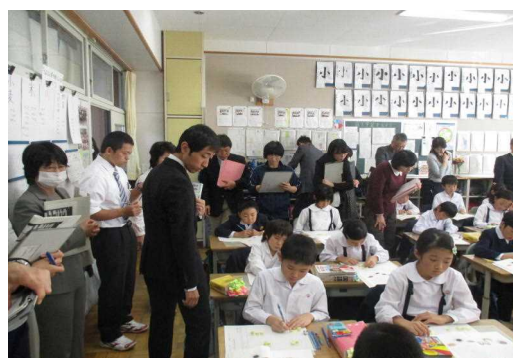
小学校での公開授業

中学校は、いわき市中学校教育研究会の授業公開であったため、小学校からも10名以上の多くの先生方に参観していただき、生徒の成長の姿と専門的な指導についての感想もいただいた。