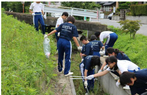
生徒会で呼びかけた生徒たちによるゴミ拾い