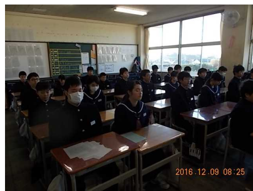
中学校でのセルフコントロールの様子

(※セルフコントロールとは、音楽を流しながら瞑想をすることで、自分の気持ちを集中させる時間。)