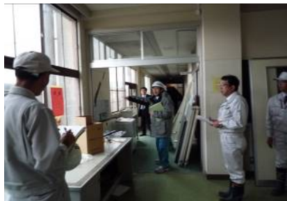
(学校施設災害査定現地調査の様子)