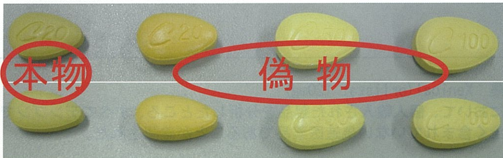
本物のC20錠の表裏 偽物のC20錠、C50錠、C100錠の表裏 (本物には、C50錠、C100錠は存在しない)