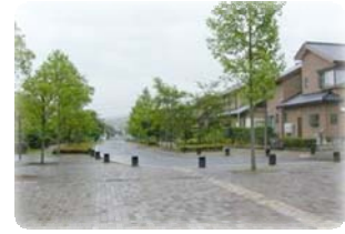
郊外部との連携・交流 街なかとの住み替えや交流 工業系用途等の適切な誘導 等