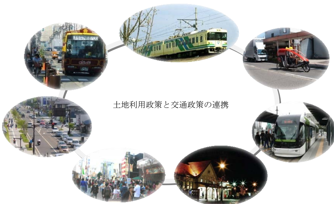
土地利用政策と交通政策の連携