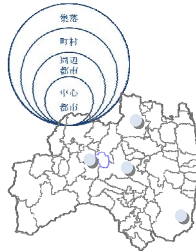
—段階的なつながりを持つ都市—