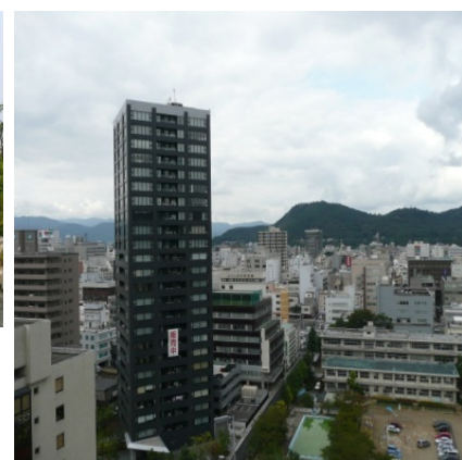
—水と緑を重視した都市環境の整備—