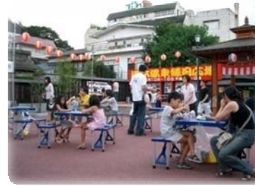
多用途の 在、職住近接 生活利便性と 性の向上 コミュニティ関係多様化 やサービスの確保 等