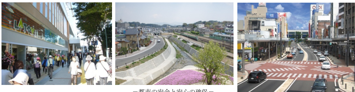
—都市の安全と安心の確保—