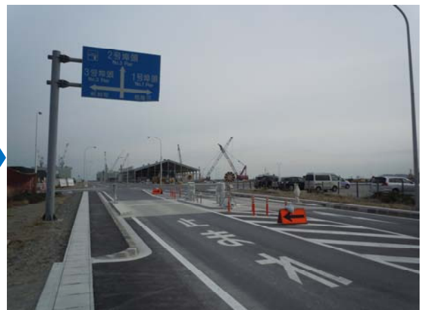
がれきで覆われた臨港道路