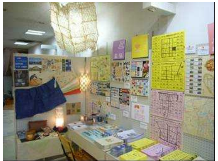
和紙やUD うつわの紹介、福島の各種マップを展示・配布 (福島県建築士会福島支部女性委員会の協力)