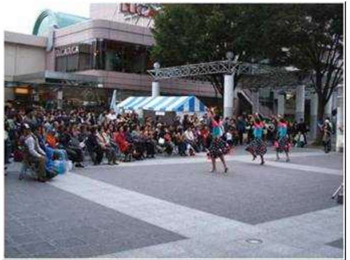
いきいきふくしま元気 UP フェスタ 2007 10/20 (街なか広場、東口駅前広場)