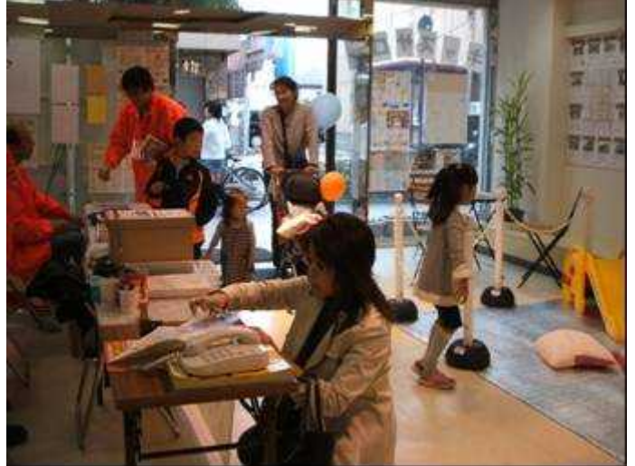
まちなか総合案内所の様子