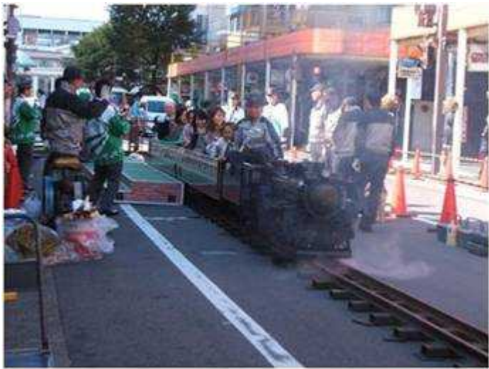
いきいきふくしま元気UP フェスタ 2007 11/21