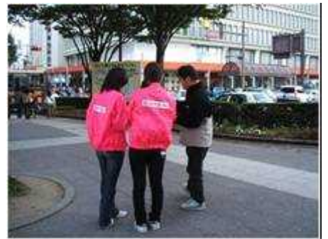
まちなかサポータも大活動