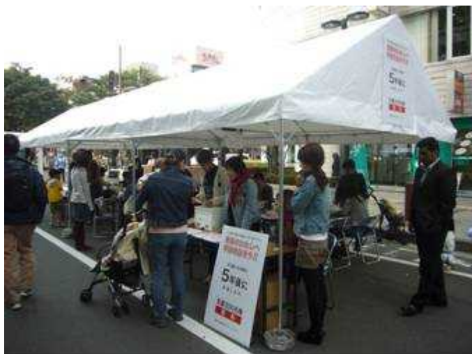
未来のわたしへ手紙を出そう! 11/4