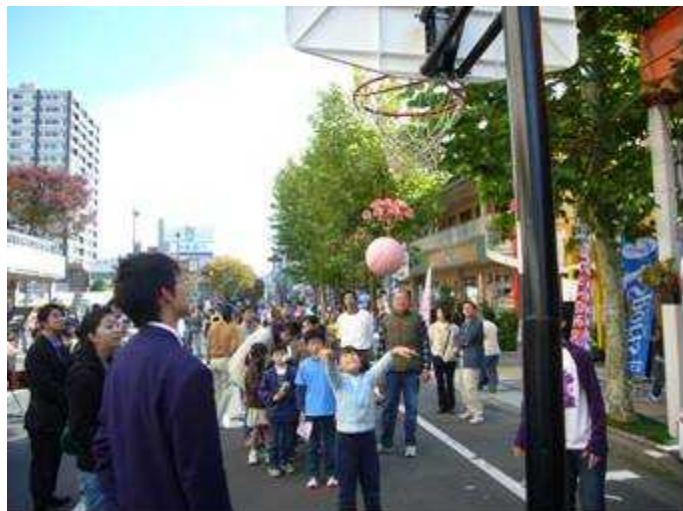
ふくしまフレンドパーク 11/3