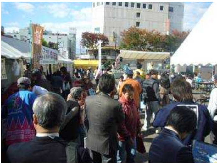
県北うまいもの市場 11/3