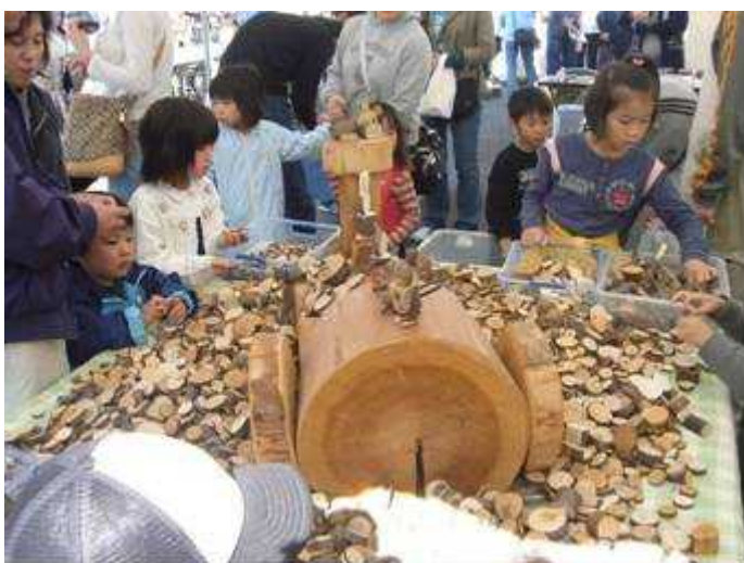
街なかイベント広場・木工教室 11/3