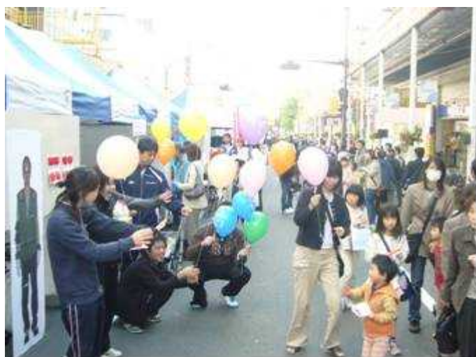
第 20 回ふれあい広場 11/3