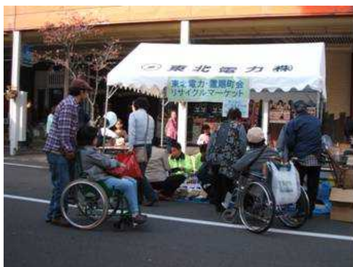
東北電力・置賜町リサイクルマーケット 11/4