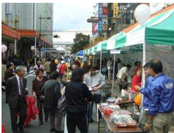
「結・ゆい・フェスタ 2007」 11/4