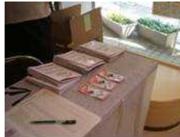
まちなか親子探検隊