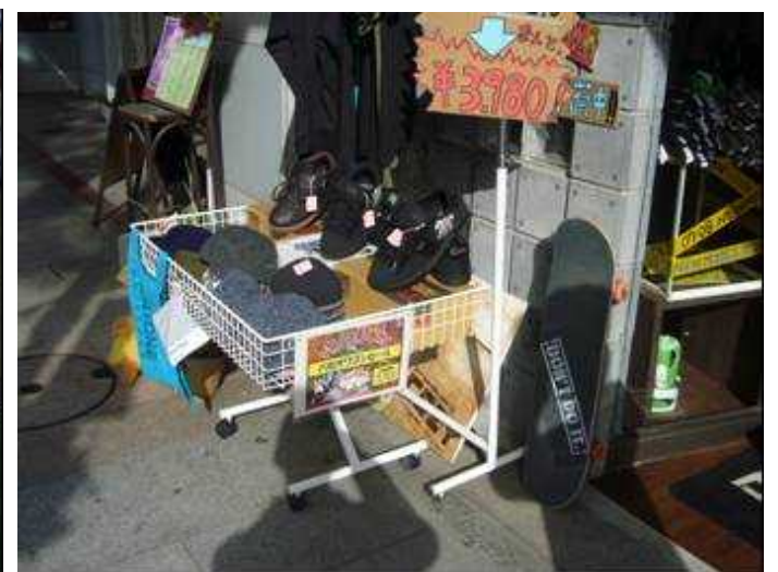
パセオワゴンセール（パセオ通り）：25店舗が参加