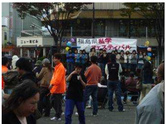
福島県私学フェスティバル 11/4