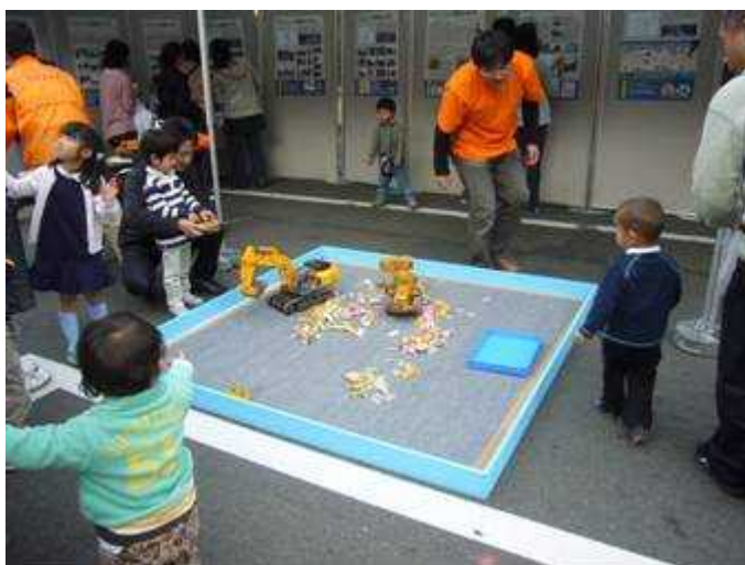
「学びのエリア」～昔のみち、今のみち～ 11/4