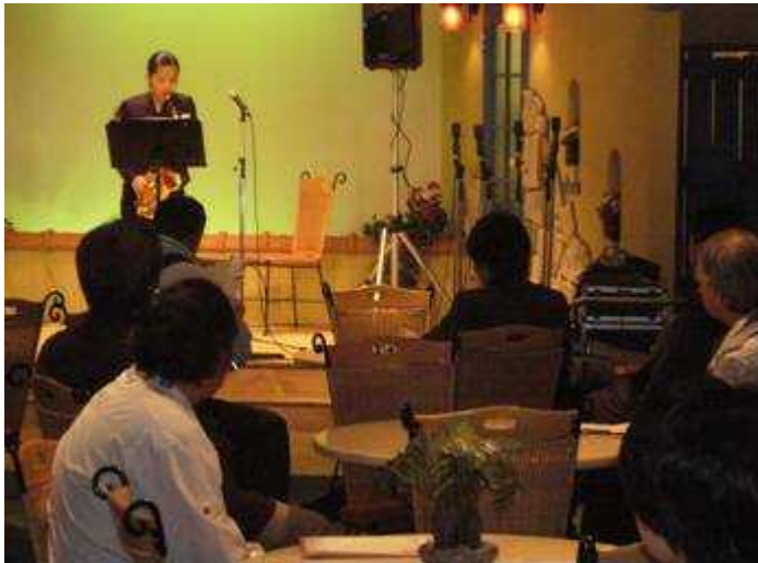
福島学院大学駅前キャンパス 11/3