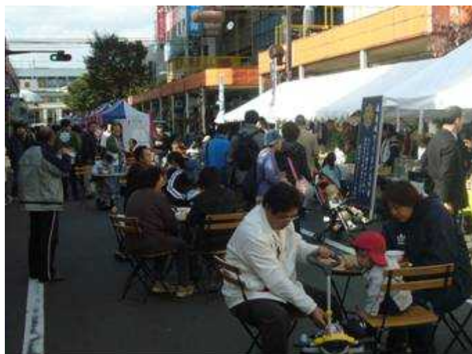
福島城下うまいもの市 11/3