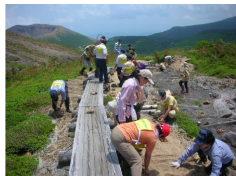
（昨年の作業状況 酸ヶ平 H22. 6. 20）