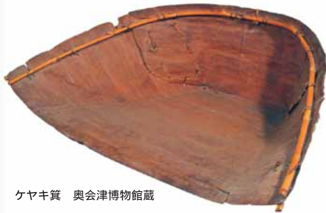
ケヤキ箕 奥会津博物館蔵