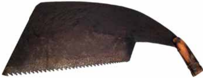
マエッピキ：製材用の鋸