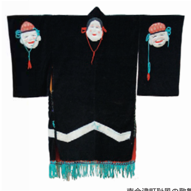
南会津町耻風の歌舞伎衣裳 奥会津博物館蔵