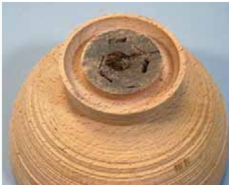
木地碗の底 固定したあとがみえる