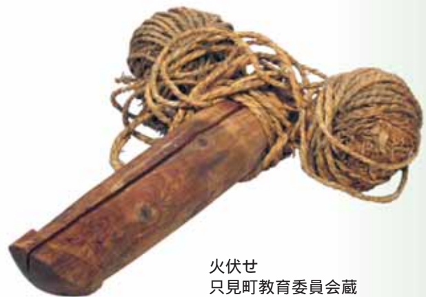
火伏せ 只見町教育委員会蔵

木々に囲まれ、生育する木々を利用して営まれる生活をこれから見ることにする。たとえば、樹木を利用するといっても、それは時代により変化する。当然のことながら現在とはかつてと同じではない。その過去もずっと変化の連続だったはずだ。「麻」という産業を失ったときにどう対応したか。全国を覆った「養蚕」だっていまは見る影もない。そう、サワグルミで箕を作るひとはいるかもしれないが、もう蚕座は作らないだろう。