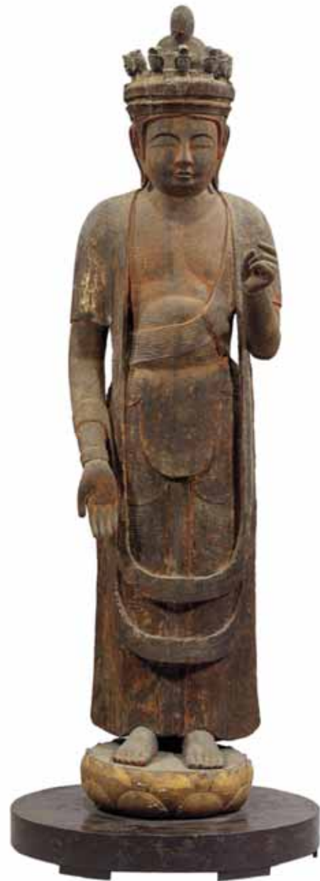
木造十一面観音立像（明光寺）

会津若松市御山の明光寺は徳一が開いたと伝えられている。この仏像は頭から腕なども含めて一本の木から彫りだされている。鑿のあとが残されているが、荒々しさの表現というよりは木の質感を表現しているものと思われ、全体的に穏やかな姿になっている。像高188.2cm。12世紀。