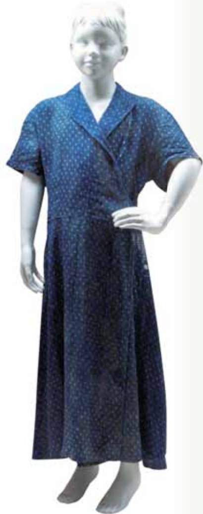
カラムシのワンピース 昭和村教育委員会蔵

しかし、かつてゼンマイ綿を使った織物があったという話を旧伊南村の村史編纂に携わっていた方がしていた。今はもう亡くなられてしまったので、確かめようもないのだが、実際のところどうだったのだろうか。