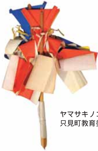
ヤマサキノゴヘイ 只見町教育委員会蔵