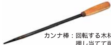
カンナ棒：回転する木材に押し当てて削る