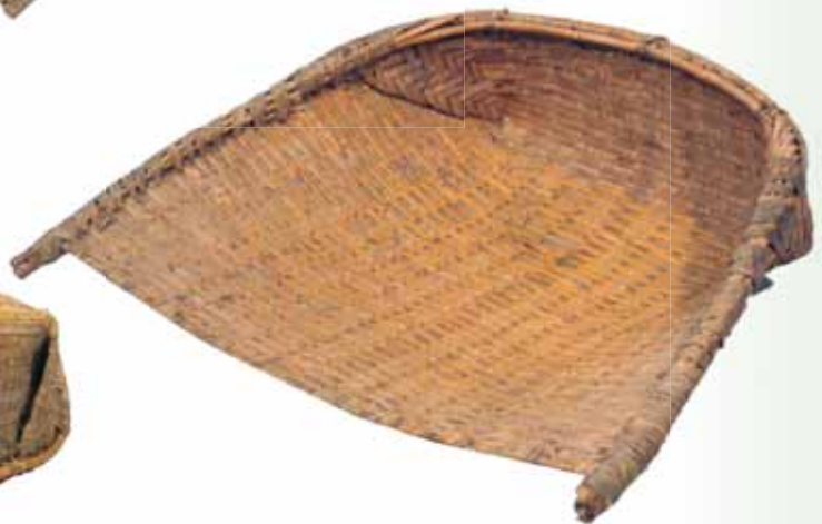
只見の竹箕 只見町教育委員会蔵

たく異なる材質からできているが、その構造は共通している。チリトリ型とも言われるように片方に開いた形をしているが、どちらも閉じたところは素材を折り返して縫い上げてある。