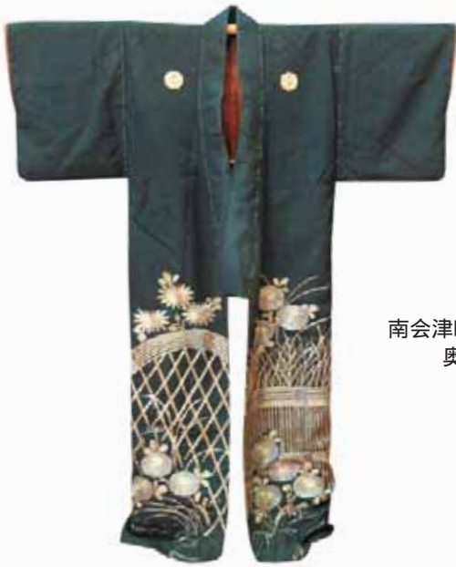
南会津町耻風の歌舞伎衣裳 奥会津博物館蔵