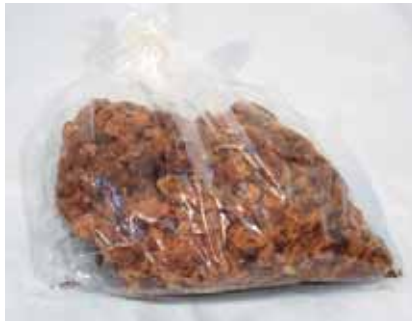
ゼンマイ綿 只見町教育委員会蔵