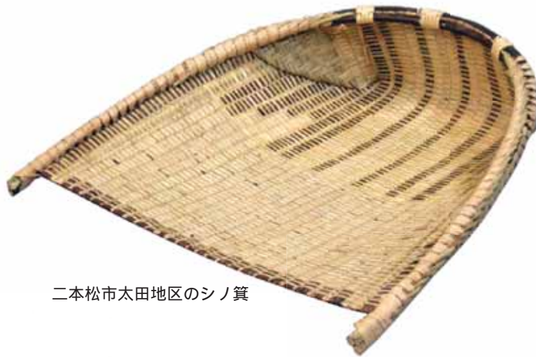
二本松市太田地区のシノ箕