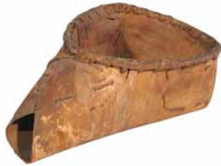
ジョウゴ箕 奥会津博物館蔵