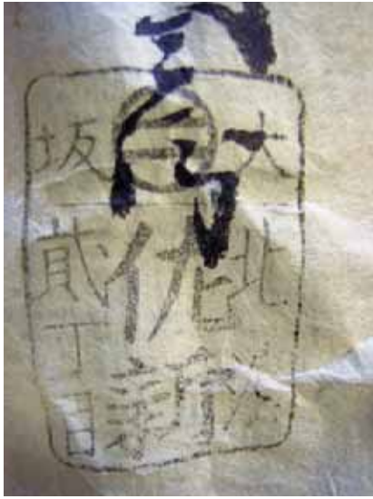
仕切り伏の印「大坂北浜二丁目 佐新」