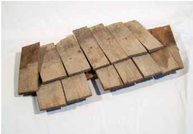
コバ屋根の一部 奥会津博物館蔵