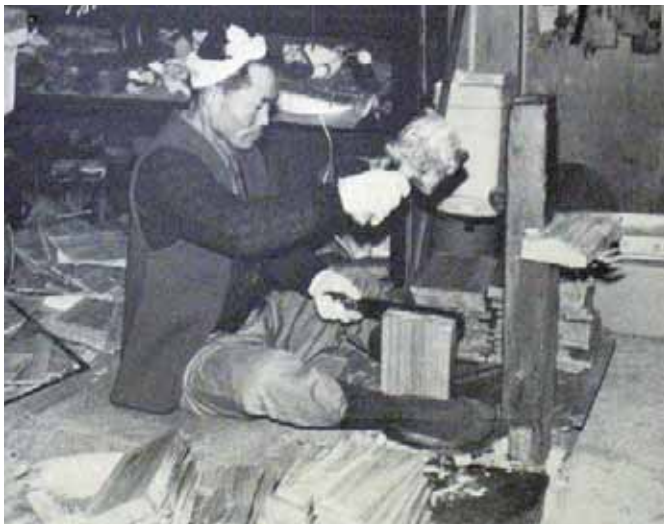
コバを割る 奥会津博物館南郷館蔵