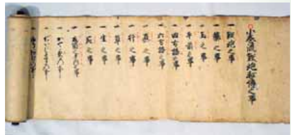
鉄砲巻物 只見町教育委員会蔵