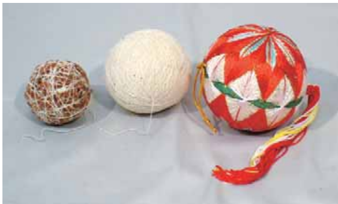
只見の手毬 只見町教育委員会蔵