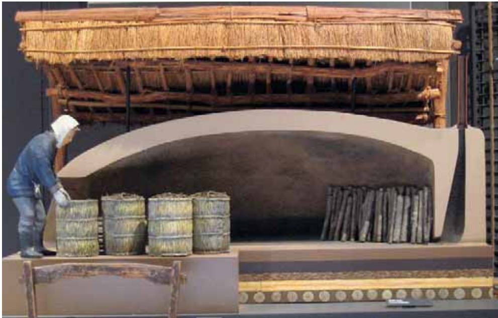
大竹式炭窯の断面模型