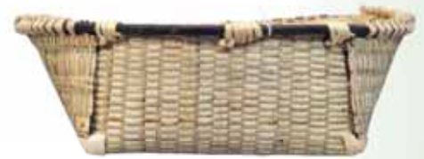
シノ箕の折り返し部分