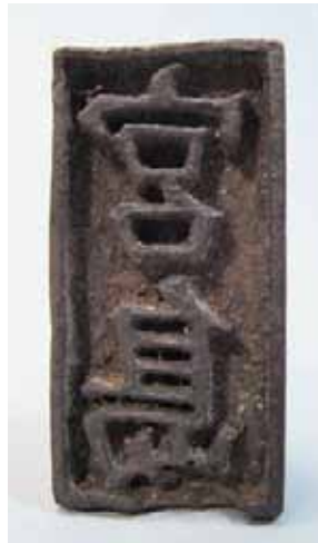
左 シャモジ 右 焼印「宮島」