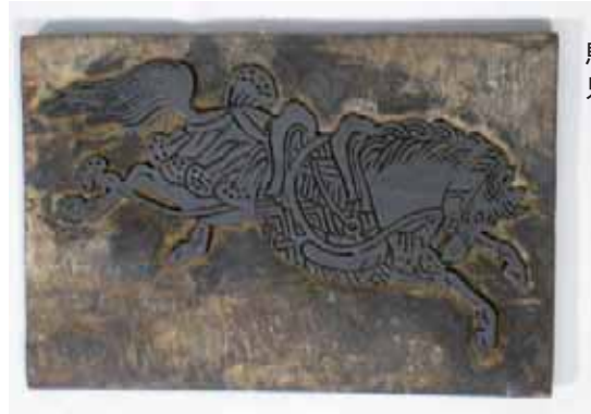
馬の版木 只見町教育委員会蔵