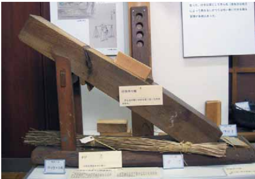
付木削り 奥会津博物館南郷館蔵

会津の山中からは遠く離れた相馬で山林のことを聞いていた。話は昭和38年に嫁入りした奥さんの昔をふりかえる感想である。自分が嫁にくるまでは山は景気が良く、薪を求める人に売ること十分潤っていた。海岸近くに居住して、燃料となる薪を生産できる山を持たない人たちは買うしかなかった。売りものとしての山が機能していた。一山の木を売れば嫁に出す用意などは十分できたという時代だった。富を生み出してきた山は数代前の先祖が買い求めたものだった。先見の明が30年代までの豊かさをもたらしたのだった。ところ