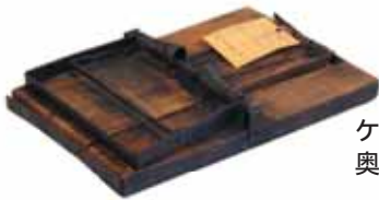
ケモノトリ 奥会津博物館蔵