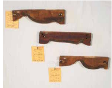
スリガタ 奥会津博物館蔵 この曲線にガイドを押し付けていけば、そのとおりに碗や皿が削れる

以前にビデオを撮影した時に「主役」になっていた元木挽きの人に話を聞いたことがある。どうしてこの職業を選んだのかというと、単純に、景気がよく、金になったからだったという。