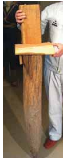
コバの削り台 奥会津博物館蔵 下の写真のように使う