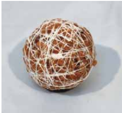
ゼンマイの綿の心 只見町教育委員会蔵