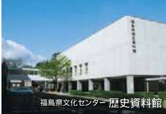
福島県文化センター 歴史資料館