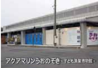
アクアマリンうおのぞき - 子ども漁業博物館 -