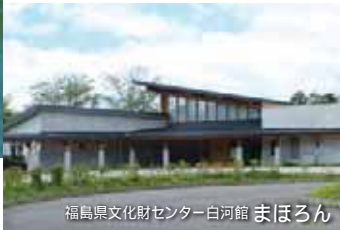
福島県文化財センター白河館 まほろん