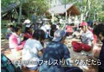
ふくしま民の森 フォレストパークあだたら