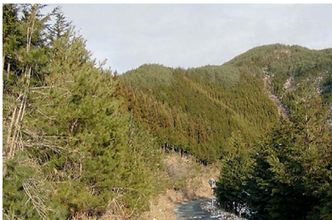
森林国営保険等により復旧した森林の姿（原町市）