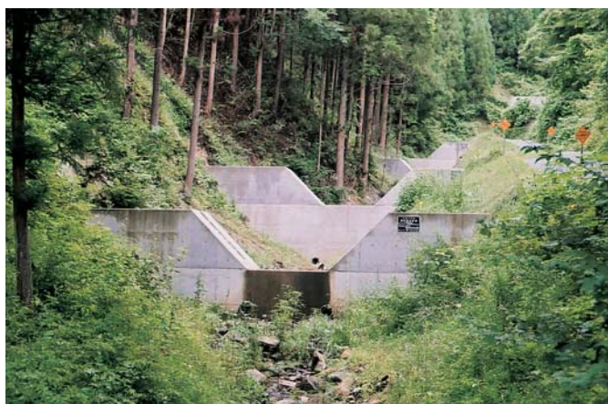
高さを抑えた治山施設（浪江町）