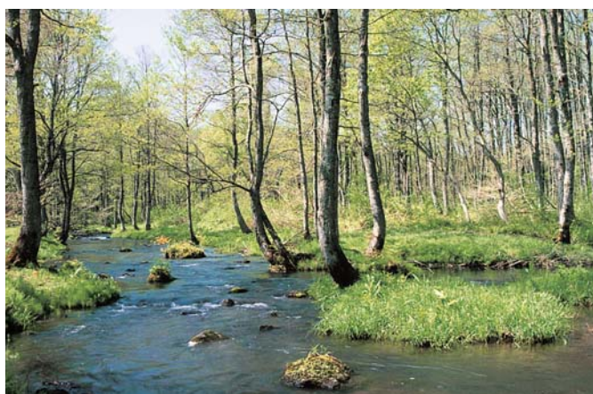
水源かん養保安林(北塩原村) 保安林制度100周年記念写真コンテスト最優秀作品