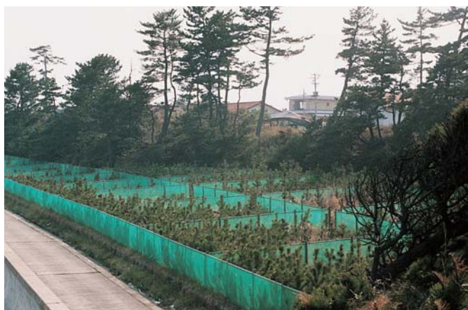
海岸の保安林整備(鹿島町)