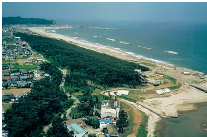
保全対象松林（いわき市）