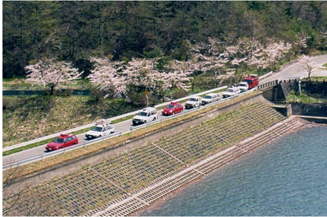
林野火災予防のパレード（飯館村）