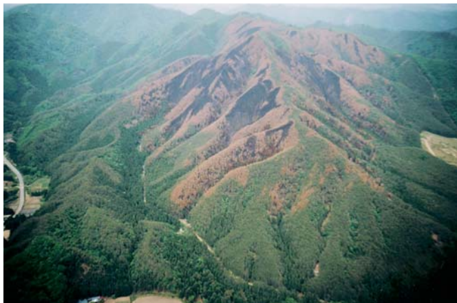
山火事被災直後の森林（原町市）