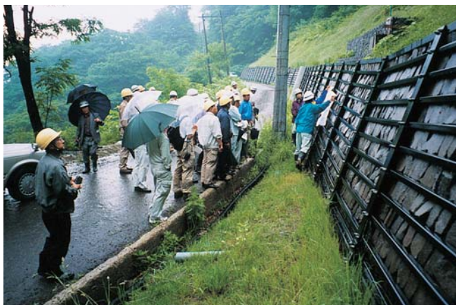
山地防災ヘルパー研修会（福島市）

山地の保全と災害防止のために、自主的に協力してくれるボランティア活動者を知事が認定している。平成14年現在114名。