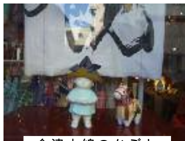
会津木綿のかぶと

5 月 5 日「子供の 日」は大町通りの 歩行者天国です。 楽しい企画がたく さんありますので 一日中遊べます！