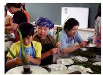
おやつツッキングでちまきづくり

親子で参加する食育講座、お米を使ったおやつツッキング、わが家の自慢料理コンテストを開催。コンテストで入賞したトマトスープは、地元小学校の給食メニューにもなっています。