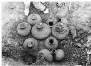
鳥内遺跡再発掘の様子

県内の重要文化財紹介シリーズ第6弾。今回は、石川町の県指定史跡「鳥内遺跡」の墓跡から発見された弥生土器などを展示します。