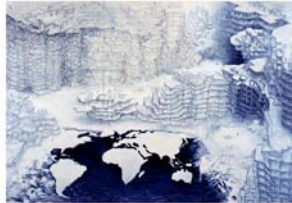
「北極」2007年/カンヴァス・油彩