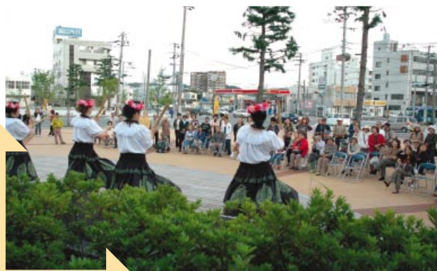
商店会の協力も得て、街なかのさまざまな場所がステージとなりました。大道芸を真剣に見る子どもたち。みんなが楽しめるイベントです。観客の皆さんは雨の中でも傘をさして立っただけで見てください。

いわき市平地区は、昔から商業の拠点として、また文化・教育・歴史の中心地として重要な役割を果たしているいわき市の顔です。ところが、他の地方都市と同じように、平地区にも空洞化の波が押し寄せられています。街角に空き店舗が目立つようになり、若者が歩いていない寂しいまちになっているのです。そんな状況を何とかしたいと、地元で音楽活動をしているグループが中心となって、仙台市の定禅寺通