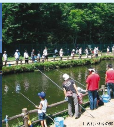
川内村いわなの郷